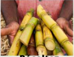
Récoltez la canne à sucre