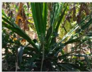
Utilisez le sisal pour fabriquer les sacs