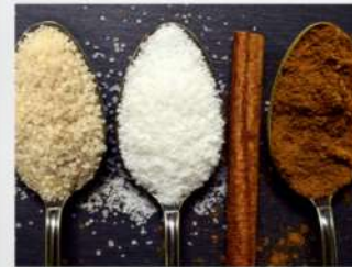
Dégustez le sucre blanc ou roux