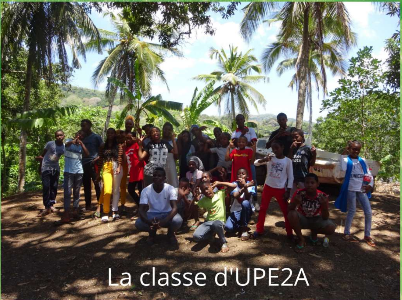
La classe d'UPE2A