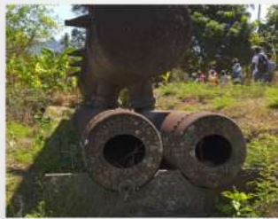
A l'aide d'une chaudière à vapeur