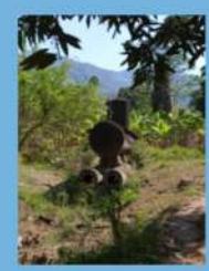
LES BANGAS DE TSIMKOURA