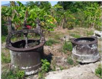
Chauffez à petit feu