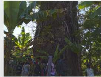
Cheminée de l'usine