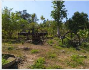
Pressez la canne pour en extraire le jus